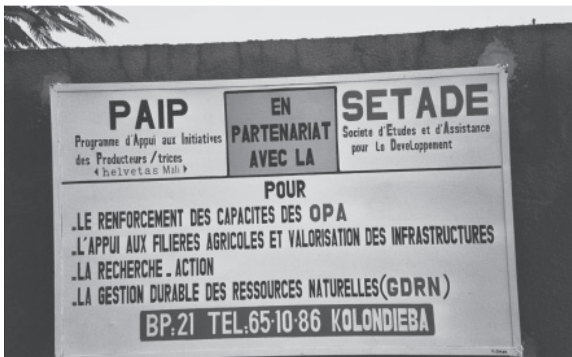
Les prestataires privés se présentent.

En plus du travail en cours depuis longtemps, c.à.d. l'appui aux prestataires privés et le suivi technique, il reste surtout à faire un grand travail d'assistance aux OPA pour que ces organisations deviennent autonomes voir se fusionnent en des organisations faîtières nationales capables d'apporter un appui concret aux producteurs/trices membres de ces organisations. En ce moment, les OPA commencent seulement à se mettre en place, mais ce sont encore pour la plupart des organisations peu structurées, avec un fonctionnement rudimentaire et souvent de type communautaire.