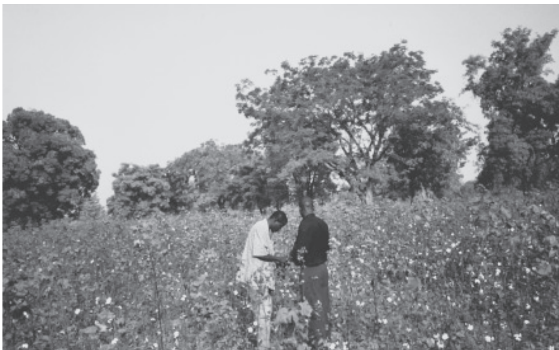
La culture de coton biologique à Kolondieba: le résultat est encore peu convaincant.

Avec l'avènement de la décentralisation au Mali, les compétences en matière des Conseils Communaux ont été clairement définies en générant ainsi un conflit d'intérêt entre les OIV et les nouvelles instances communales.