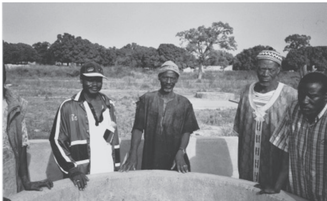
Les villageois sont contents et fiers de leur puits construit avec 10% de participation financière propre (côté total CFA 3'000'000).